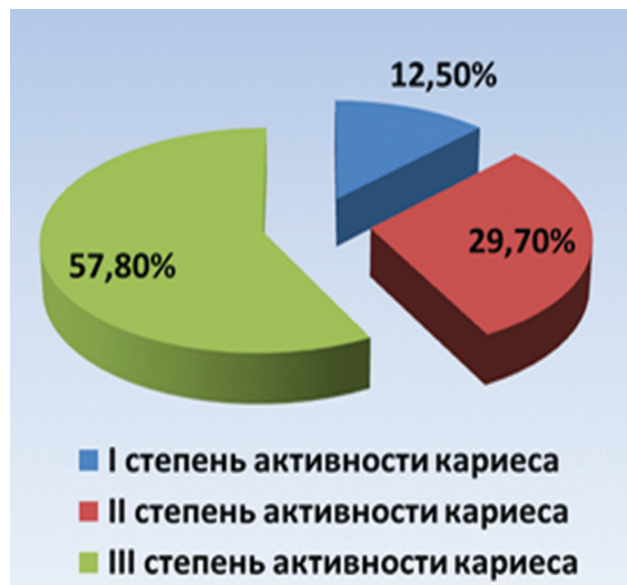
Рис. 1. Состояние зубов у детей основной группы.

Пациенты основной группы, в зависимости от степени компенсации эндокринопатии, были разделены на две подгруппы. Первую подгруппу соста-